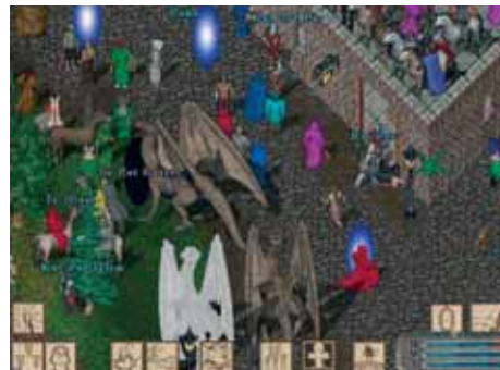
Utviklingen av online rollespill bør følges nøye, men det er viktig å huske at majoriteten av brukerne klarer å regulere spillingen selv. Rollespill som f.eks. World of Warcraft (WoW) være en utmerket arena for å øve på sosiale ferdigheter, utforske lederegenskaper og trene opp simultankapasitet og reaksjonsevne.

respekt. Gjennom denne dialogen tror jeg det er fullt mulig å få til en samværsform som også er forebyggende, sier Halvorsen.