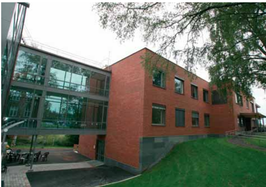
TEDD holder til i nye lokaler ved Diakonhjemmet Sykehus. Enheten har økt kapasiteten og har nå 12 sengeposter.

Målsetningen for behandlingen er ulik for ulike pasienter. – Vi vektlegger skadereduksjon, økt livskvalitet og mestring. TEDD tilbyr individuell utformet behandling til alle pasienter. Behandlingen er integrert og inneholder ulike elementer som kognitiv miljøterapi, motiverende intervju, medikamentell behandling (også medikamentelt assistert nedtrapping ved behov), rusgruppe, pasientundervisning og fysisk aktivitet. Vi legger stor vekt på god ernæ-