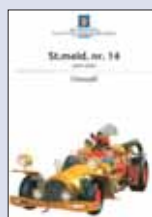
Kilde: St.meld.nr.14 (2007-2008)

Filmindustrien har dobbelt så stor omsetning som dataspillbransjen, men kun hvis man inkluderer salg av DVD og tv-inntekter. Ser man kun på kinoinntekter, er spillbransjen klart ledende også her.